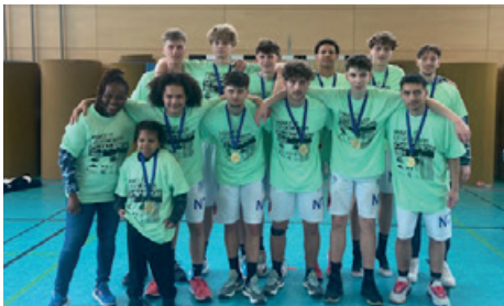
U17 gewinnt Gold

Sicher auch, weil „Coach 25“ ihren Spielern immer eins mit auf den Weg gibt: „ Alone I’m good, together we are great “. Also: „ Alleine bin ich gut, aber zusammen sind wir großartig! “ Und wie großartig sie sind, haben die Wildcats eindrucksvoll an diesem Wochenende bewiesen. Und die Vorfreude ist groß: Auf’s nächste Jahr beim internationalen Eastercup in Berlin. Mit hoffentlich noch mehr Siegen! Wildcats-Family