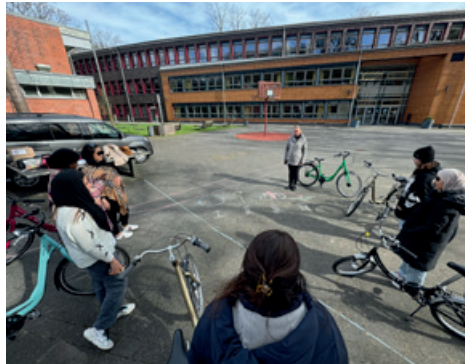
Es gab auch ein wenig Theorie

NIENDORFER LAUFLADEN Spezialist für Laufschuhe