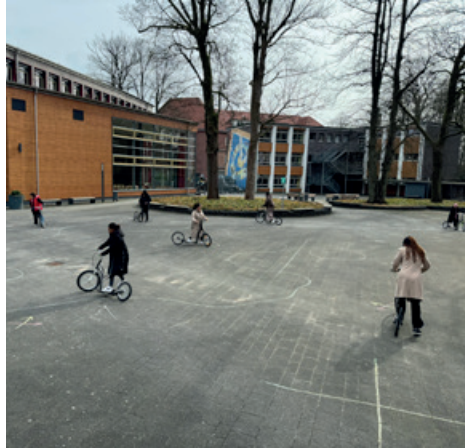
In den ersten drei Tagen wurde gerollert