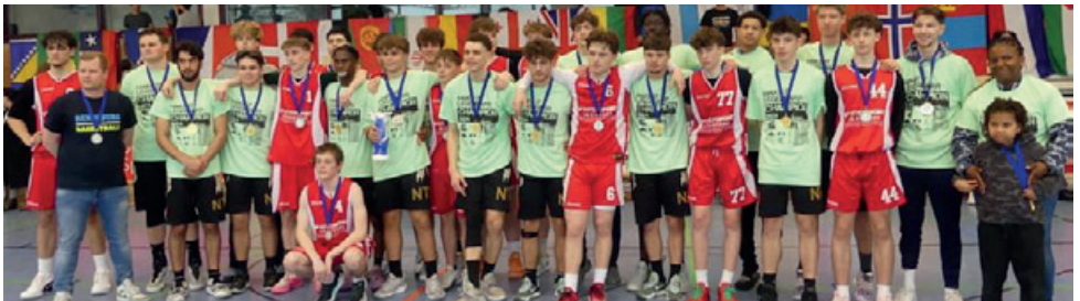
Auch das U18-Team gewinnt Gold