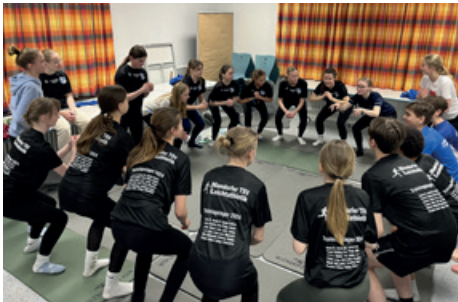
Abendliches Fitnessprogramm im Gruppenraum

Auch der Nachmittag wurde für eine abschließende Trainingseinheit genutzt. Es standen Hürdensprints auf dem Programm, und es war eindrucksvoll zu sehen, mit wie viel Einsatz alle versuchten, trotz schwerer Beine auch diese Herausforderung noch gut zu meistern. Wirklich klasse, diese Gruppe. Und durch die gute Punktausbeute beim Abschlussspiel, bei dem es galt, im Team Fragen zu den vergangenen beiden Tagen zu beantworten, konnten die angekündigten Hockstrecksprünge schließlich von 150 Stück auf 30 Stück für jeden reduziert werden. Aber auch das war nach zwei sehr trainingsintensiven Tagen nochmal eine Herausforderung. Also ein letztes Mal ins Waldgebiet zum Froschberg und alle Kräfte zusammennehmen. Mit der Unterstützung und Anfeuerung des ganzen Teams und netten Worten der vorbeigehenden Spaziergänger wurde der Froschberg von allen bezwungen. Die letzte Anstrengung war gemeistert, aber damit kam auch die Erkenntnis: Das schöne Wochenende neigt sich dem Ende entgegen. Pünktlich um 16 Uhr kamen die „Elterntaxis“, die sich zur Abholung gemeldet hatten, und es ging geschafft, aber glücklich zurück Richtung Hamburg. Zusammenfassend lässt sich sagen: Es war wirklich eine coole gemeinsame Zeit und einfach richtig schön!! Und während uns Muskelkater und schwere Beine nur für ein paar Tage begleiten werden, werden