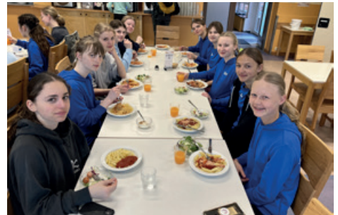
Gemeinsames Essen in der Jugendherberge