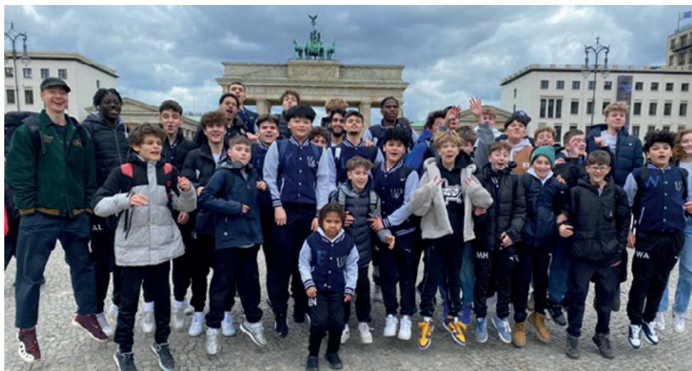
Wildcats erobern Berlin