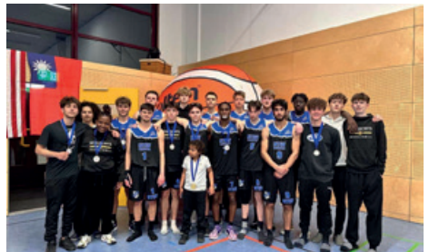
Die U20 freut sich über die Silbermedaille