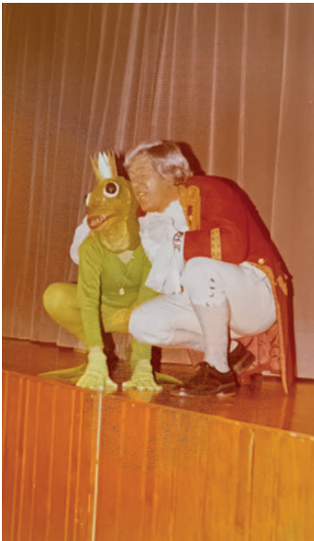
Der Froschkönig 1975

Verschwörungstheoretiker verbreiten Angst und Schrecken, politische Lager nutzen die sozialen Medien für ihren Wahlkampf und mit Manipulation durch Künstliche Intelligenz können wir eh nur noch die Hälfte von dem glauben, was wir da sehen. Unser Leben ist rasanter, stressiger, aufreibender und schnelllebiger geworden. Wir werden mit Nachrichten bombardiert, deren Halbwertszeit in Stunden gemessen werden kann.