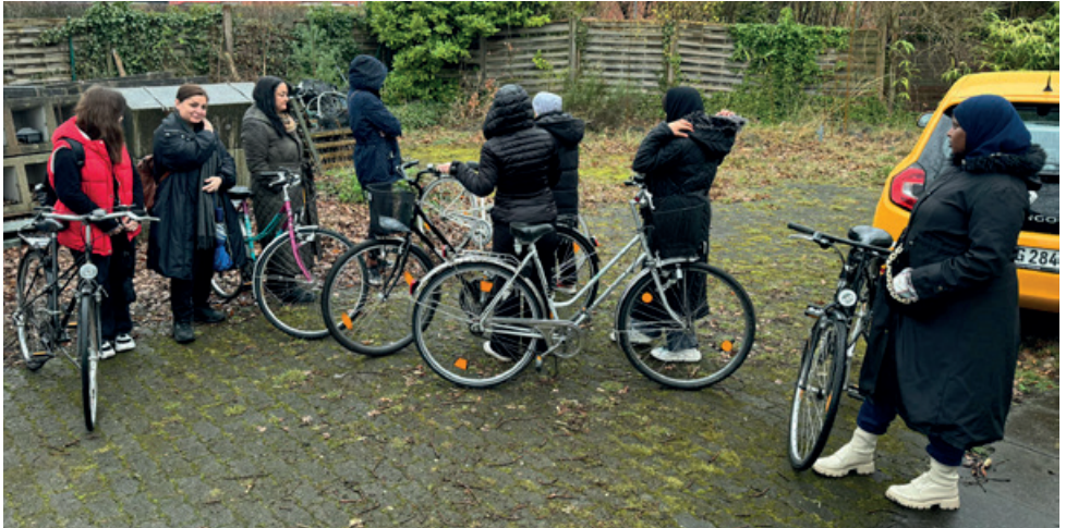
Bei der Übergabe der gebrauchten, gespendeten Räder

ständig angesehen wird, die die Mobilität und auch das Selbstwertgefühl der Migrantinnen aber unfassbar verbessert.