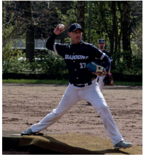
Pitcher in Aktion