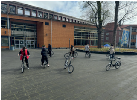
Ab dem vierten Tag wurden erst kleine, dann große Räder genutzt