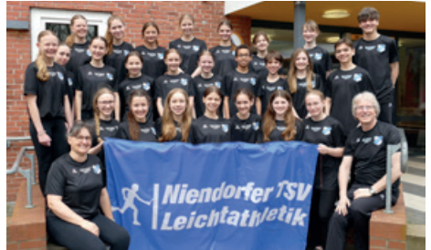
Team mit Trainingslager-T-Shirt Feuer und Flamme für Flensburg 2024