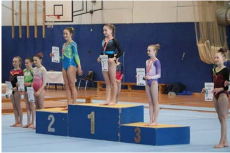
Siegerehrung AK 12-13