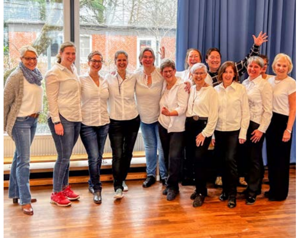
Die Line Dancer (Brillant und Bronze) mit ihrer Trainerin und ihrem Trainer