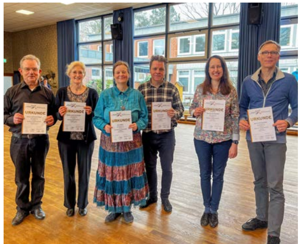
Die erfolgreichen Paartänzer