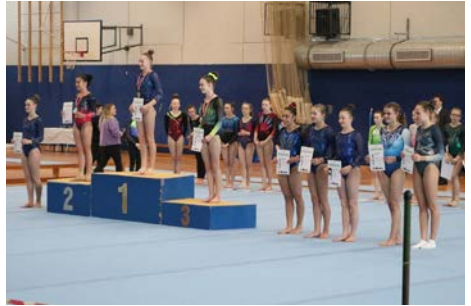
Siegerehrung AK 14-15