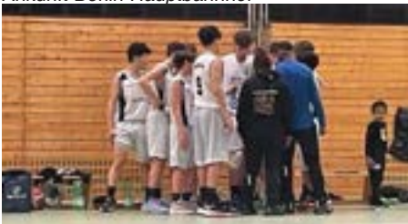
Konzentration vor dem Spiel

Am Freitag startete die U-15-Mannschaft mit einem knappen 46:41- Sieg gegen die Stuttgart Eagles.