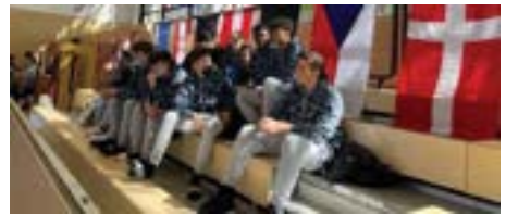
Danke an die U16 für ihre Unterstützung!

Die U-16-Wildcats gewannen am Freitag ebenfalls beide Spiele gegen Mannschaften aus den Niederlanden und der Türkei. Die Mannschaft zeigte eindeutig ihre Favoritenrolle und gewann die Spiele eindeutig mit bis zu 40 Punkten Vorsprung.