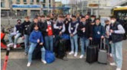
Ankunft Berlin Hauptbahnhof

14. bis 18. April in Berlin-Moabit. Für einige Wildcats-Spieler ist es die vierte Teilnahme an diesem Turnier, und die Vorfreude aller war groß.