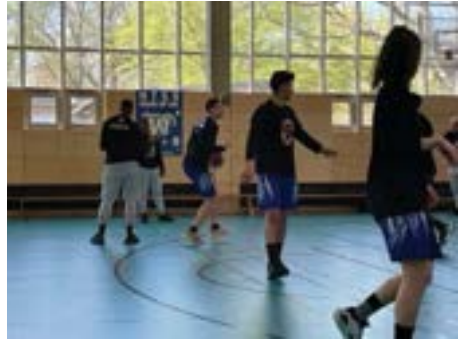
Warm-up zum Spitzenspiel gegen ASC Theresianum Mainz

Das Finale der U16 gegen Hanau gestaltete sich hart umkämpft, am Ende verloren die Wildcats mit