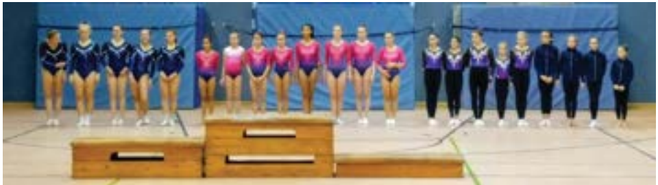
Zum Freundschaftswettkampf der Leistungsturnerinnen waren fünf Mannschaften angetreten v.l.n.r.: WTSV Concordia, NTSV 1 und NTSV 2, HT16 und Turnclub HH