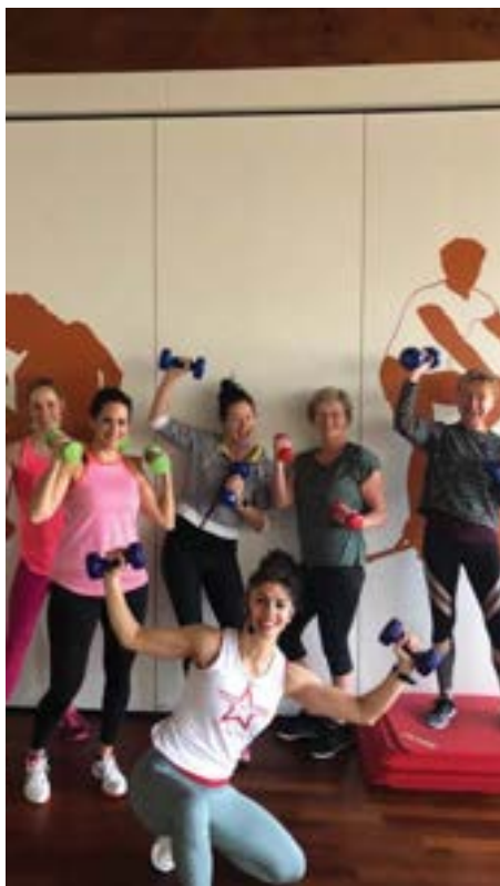
Fitness-Kurse im ADYTON: bei uns gibt es jede Menge Spaß!