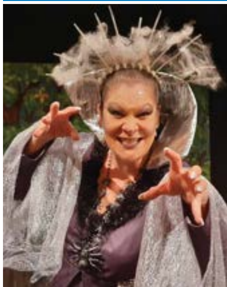
Feen, Zauberer, Drachen